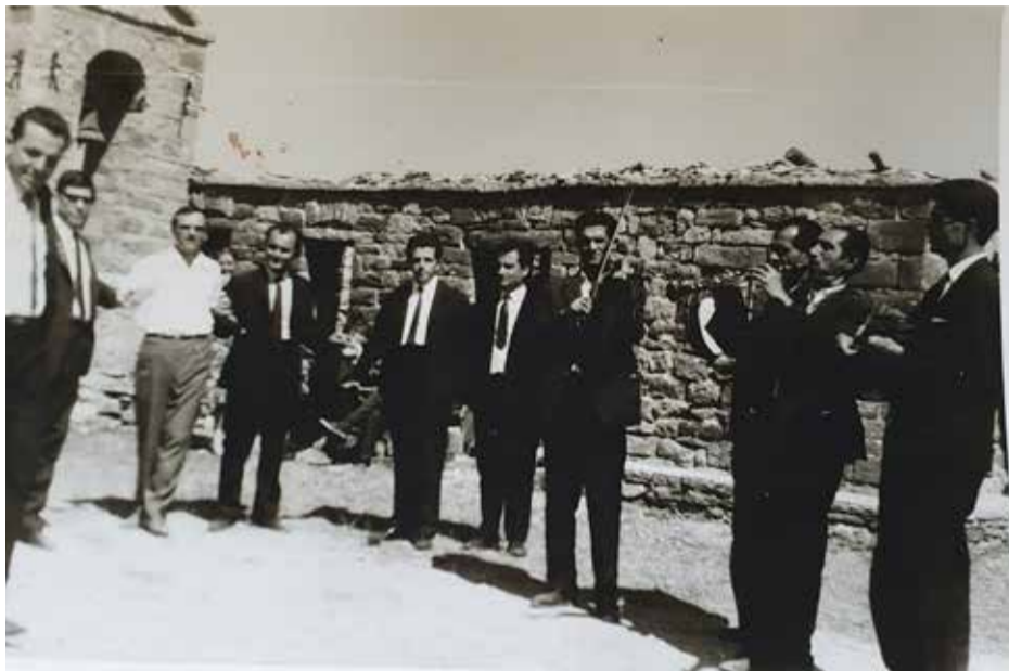
Η ζυγιά στην εκκλησία

Τ α πανηγύρια, όπου το τραπέζι εγένετο στα σπίτια των εορταζόντων: