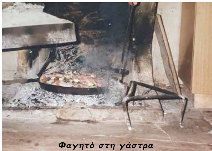
Φαγητό στη γάστρα