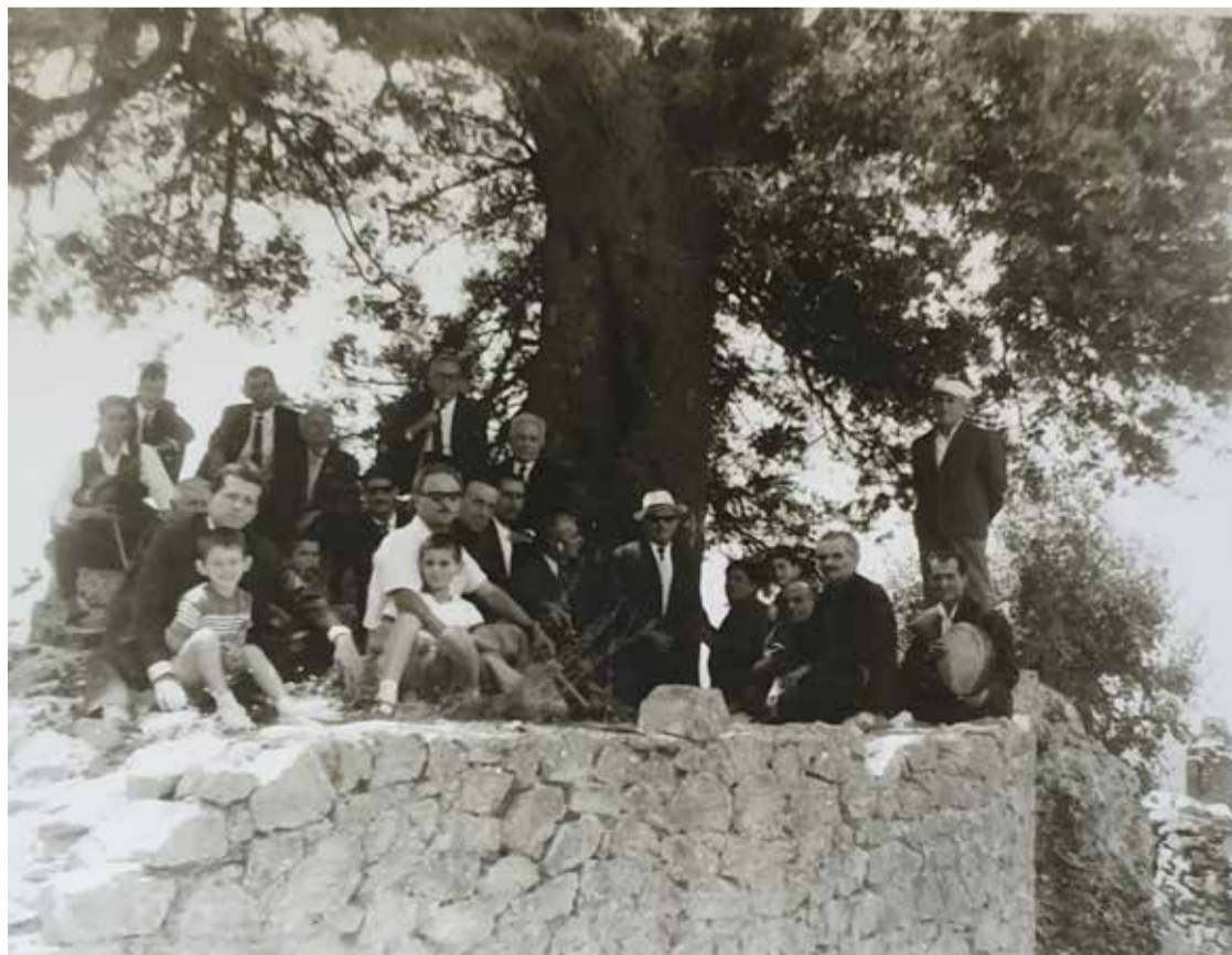
Στην κόντρα κάτω από την εκκλησία, μετά τις βίζιτες στο μαχαλά