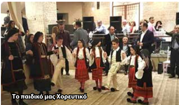
Το παιδικό μας Χορευτικό