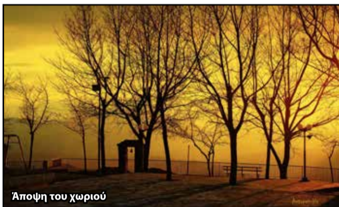
Αποψη του χωριού