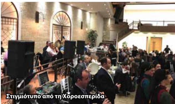
Στιγμιότυπο από τη Χοροεσπερίδα

Η μεγάλη προσέλευση του κόσμου μάς ευχαρίστησε όλους πάρα πολύ, ενίσχυσε σημαντικά από οικονομικής άποψης την Αδελφότητά μας, λόγω και της μεγάλης ανταπόκρισης του κόσμου στη λαχειοφόρο αγορά, αλλά παράλληλα πρέπει να αποτελέσει κίνητρο, ώστε να παρακινήθουν ακόμη περισσότερο οι ίδιοι οι Αετοπετρίτες, μεγαλύτεροι, αλλά και νεότεροι, με ή χωρίς παιδιά, ώστε να δίνουν το παρόν στο οποιοδήποτε κάλεσμα του χωριού μας. Μόνο με την παρου-