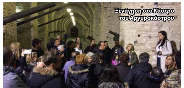
Ξεναγήση στο Κάστρο του Αργυροκάστρου

χώρια, στη Μονεμβασιά ή το Πήλιο. Πάνω από την πόλη δέσποζε το Κάστρο, το οποίο επισκεφτήκαμε και πληροφορηθήκαμε από την ξεναγό για την πλούσια ιστορία του. Από εκεί μπορούσε κάποιος να ελέγξει στρατηγικά την πόλη, ενώ το βόρειο τμήμα του λειτουργούσε ως φυλακή όπου ήταν έγκλειστοι πολιτικοί κρατούμενοι κατά το κομμουνιστικό καθεστώς. Σήμερα έχει πέντε πύργους, έναν πύργο ρολογιού, μια εκκλησία, στάβλους αλόγων και ένα υπαίθριο θέατρο, όπου λαμβάνει χώρα συνήθως κάθε 4-5 χρόνια ένα φολκlorικό φεστιβάλ παραδοσιακού αλβανικού χορού αλλά και διάφορα πολιτιστικά δράματα. Από το ρολόι, στο φως της ημέρας, θα μπορούσε κανείς να