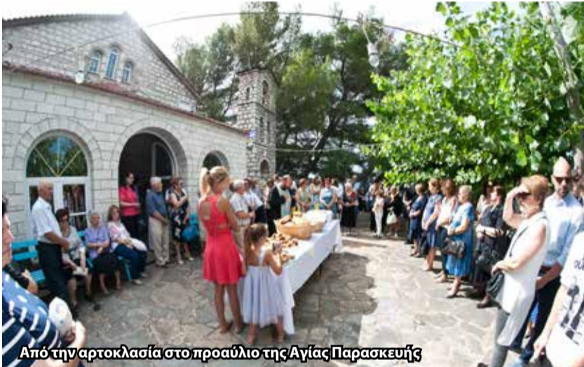
Από την αρτοκλασία στο προαύλιο της Αγίας Παρασκευής

Οι προετοιμασίες ξεκίνησαν με την αγορά των προμηθειών για το πανηγύρι με φροντίδα των μελών του Δ.Σ. Ακολούθησαν οι