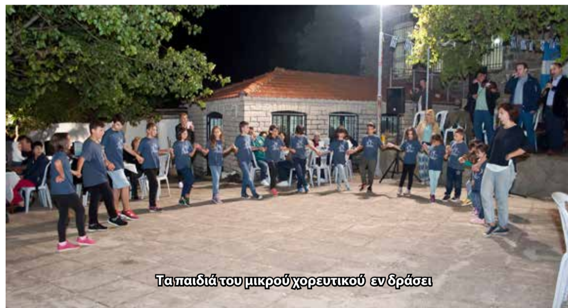
Τα παιδιά του μικρού χορευτικού ενδράσει

ΑΕΤΟΠΕΤΡΙΤΙΚΑ ΝΕΑ Ιδιοκτήτης Αδελφότητα Αετόπετρας Δωδώνης Ηπείρου Ελ. Βενιζέλου 91 185 34,, Πειραιάς τηλ.-fax: 210-4224262