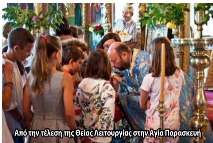
Από την τέλεση της Θείας Λειτουργίας στην Αγία Παρασκευή